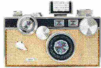
Chic&click la camera bag con strass, Judith Leiber.