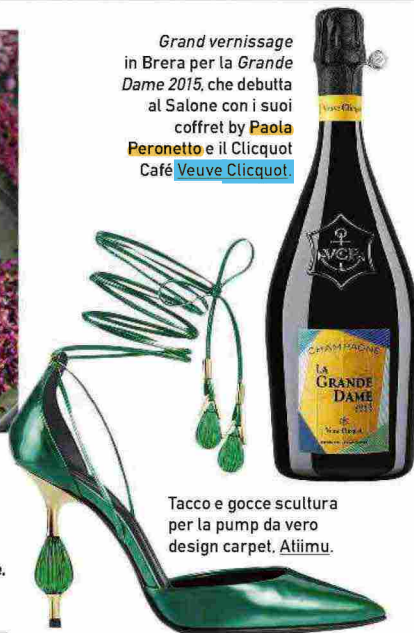
Tacco e gocce scultura per la pump da vero design carpet. Atium .

Grand vernissage in Brera per la Grande Dame 2015 , che debutta al Salone con i suoi coffret by Paola Peronetto e il Clicquot Café Veuve Clicquot .