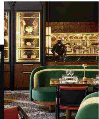
Non si sa se stuzzica di più la vetrina per meat-lovers o gli interni nostalgia anni '40 by Humbert & Poyet. Beefbar (cso Venezia 11).

Superclassico in lim ed per il suo 150mo. Sublime Ron Matulase m.