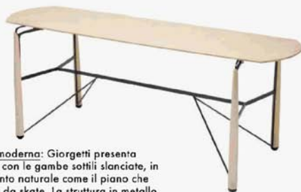
Ebanisteria moderna: Giorgetti presenta Deck, una consolle con le gambe sottili slanciate, in legno di frassino tinto naturale come il piano che ricorda una tavola da skate. La struttura in metallo verniciato antracite dona un tocco architettonico al progetto di Rossella Pugliatti. www.giorgetti.eu