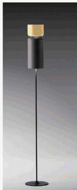
Una luce custom-made, Aspen di Werner Aisslinger per B.Lux, ha doppio paralume bicolore grazie al quale assume mille volti. Sempre in finitura mat, in sei diversi colori da accoppiare sullo stelo unicamente nero. Da terra (nella foto), da sospensione e da parete. www.grupoblux.com