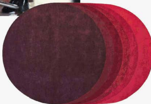
Passaggio colore: dal bordeaux al rosso, una scia geometrica per vestire gli interni. Sei dischi in lana della Nuova Zelanda compongono il tappeto Trace taffato a mano e dall'effetto dégradé firmato da Cédric Ragot per Roche-Bobois. Da cm 200x300 e da € 2.970. www.roche-bobois.com