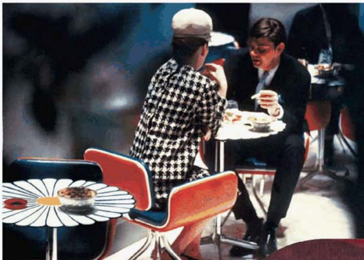
Un anno con Alexander Girard: dal 12 marzo fino al 29 gennaio 2017, al Vitra Design Museum la retrospettiva sull'ironico architetto americano. Tessuti, mobili, oggetti, documenti privati come questa foto del 1966 che immortala la Cocktail-Lounge dell'Étoile di New York disegnata a 4 mani con Charles Eames. www.design-museum.de